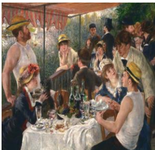
Pierre-Auguste Renoir: El almuerzo de los remeros , 1881, óleo sobre lienzo, 129,5 cm × 172,7 cm, Colección Phillips, Washington D. C., Estados

Pierre-August Renoir es uno de los más importantes representantes del impresionismo francés, movimiento del siglo XIX que revolucionó la tradición pictórica. Renoir destacó por el estudio de los efectos lumínicos, la sensualidad del trazo y la creación de atmósferas vaporosas por medio del juego entre luces y texturas. Sus temas giraron en torno a la vida alegre y festiva de la burguesía, y también expresó un destacado interés en el desnudo y la naturaleza. Estas características, que le dieron un trazo único e irrepetible de singular belleza, lo han convertido en en una de las referencias más reconocida de la historia del arte occidental.